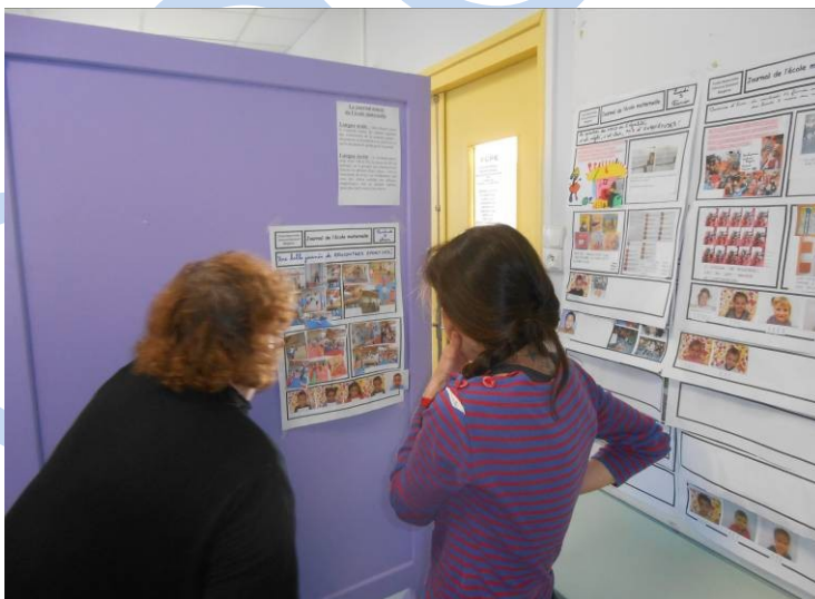
La directrice présentant l'école à travers le journal lors d'une inscription