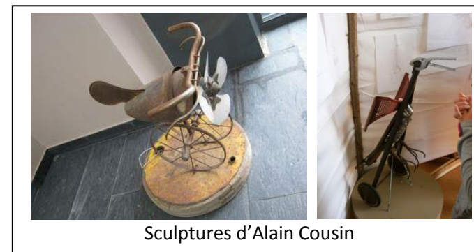
Sculptures d'Alain Cousin